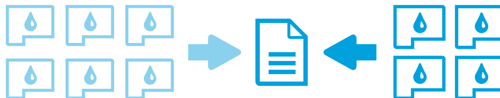
Cartuchos de tinta no originales de HP

Los cartuchos de tinta HP originales imprimen una cantidad de páginas considerablemente mayor.